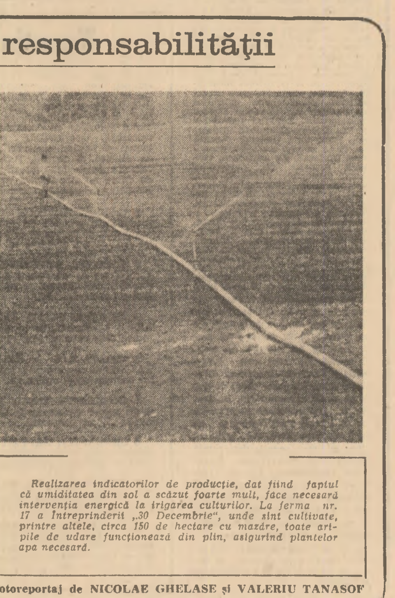
Realizarea indicatorilor de producție, dat fiind faptul că umiditatea din sol a scăzut foarte mult, face necesară intervenția energetică a irigațiilor...