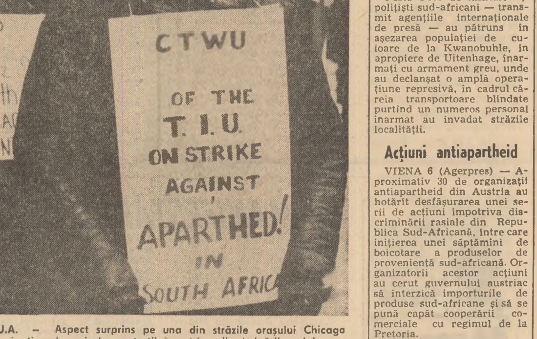
S.U.A. — Aspect surprins pe una din străzile orașului Chicago în timpul unei demonstrații împotriva discriminării rasiale

Considerăm că tineretul român și, îndeosebi, Uniunea Tineretului Comunist și-au adus o contribuție sustinută în direcția soluționării ansamblului problemelor cu care se confruntă tineretul lumii, fapt pentru care se și explică hotărârea O.N.U. de a-l desemna, în fruntea Comitetului Consultativ al O.N.U. pentru A.I.T., pe Nicu Ceaușescu, prieten de multă vreme al celor mai reprezentative organizații de tineret din Mexic, pentru a cărui activitate strălucită avem întreaga apreciere.