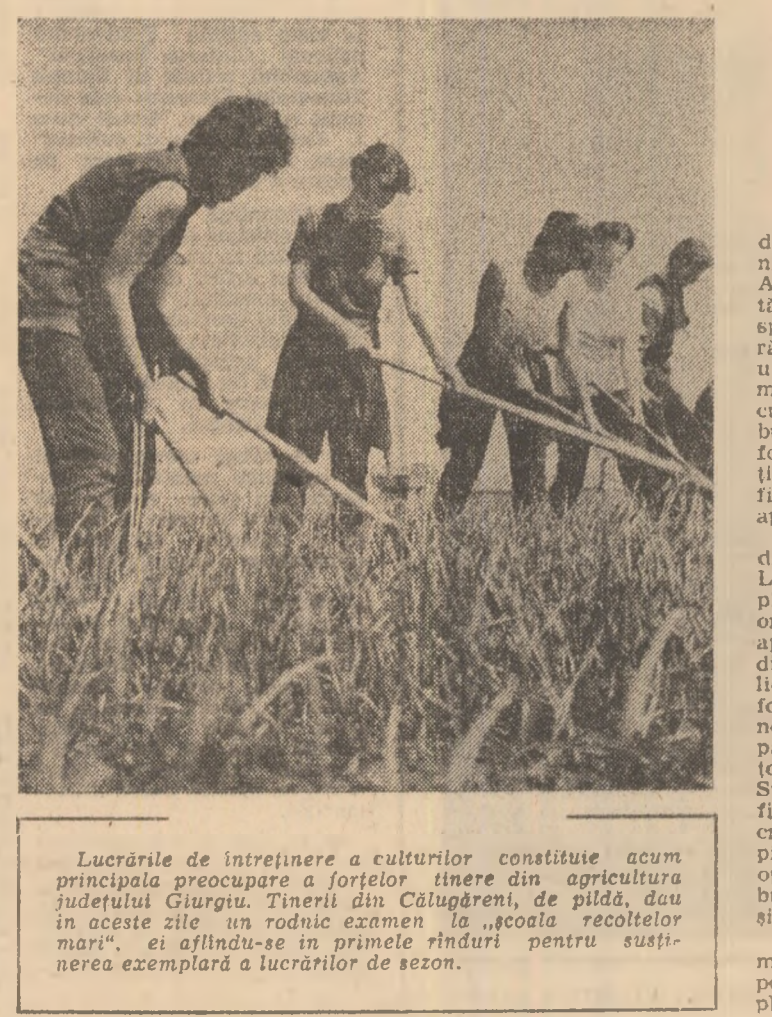
Lucrările de întreținere a culturilor constituie acum principala preocupare a forțelor tinere din agricultura județului Giurgiu...