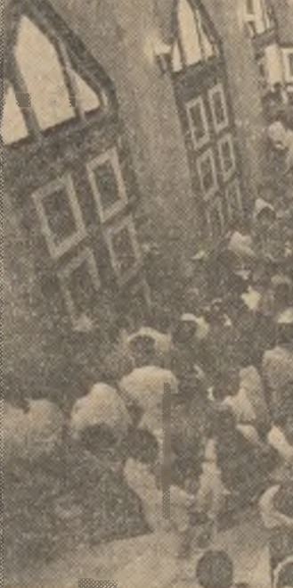
THAILANDA : Holul central al Universității din Bangkok este luat cu asalt de șomeri. Periodic se organizează aici „tirgul locurilor de muncă”. Acest instantaneu este surprins în ultima zi a unui asemenea tirg, cind peste 14 600 de persoane au venit să-și „cincece norocul” pentru îmbunătățirea condițiilor de viață

NATIUNILE UNITE 30 (Agerpres). — Președintele Consiliului Executiv Federal al R.S.F. Iugoslavia, Milka Planinc, ce întreprinde o vizită oficială în S.U.A., a avut convorbiri cu secretarul general al O.N.U., Javier Perez de Cuellar, la sediul din New York al organizației, informează agenția Taniug.