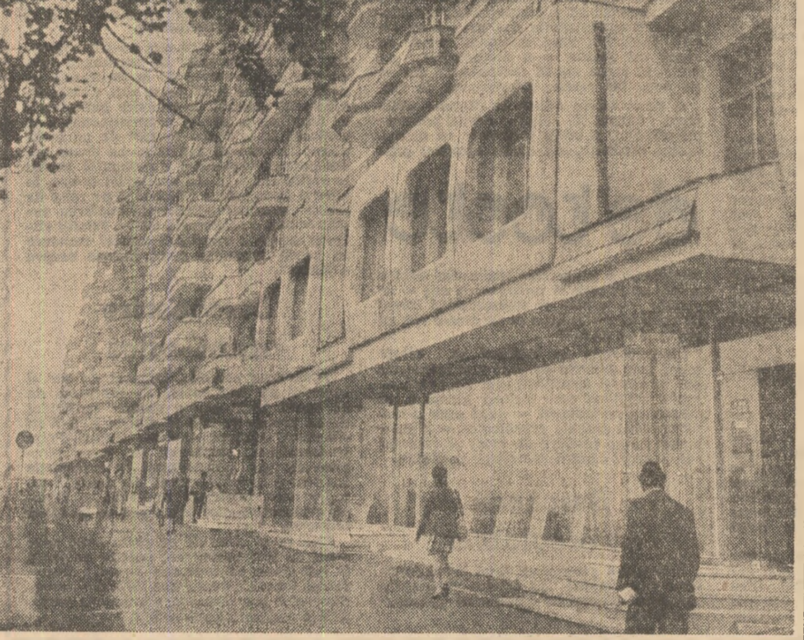
Arhitectura modernă a unui oraș în continuă dezvoltare — Bata Mare