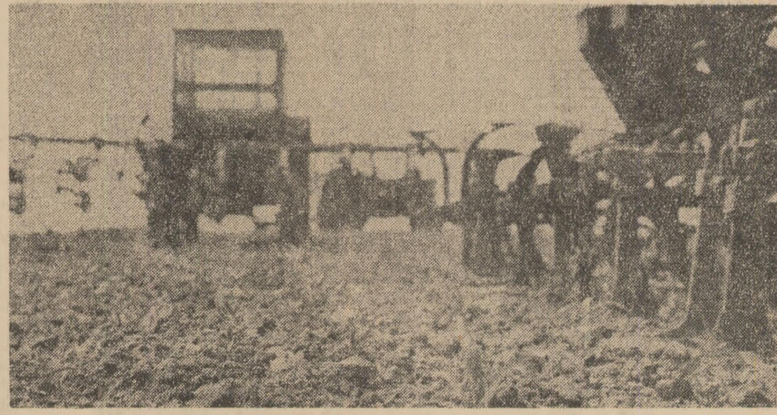
Pe frontul campaniei agricole — energie mobilizată a tuturor forțelor satului (Relatări în pagina a 5-a)