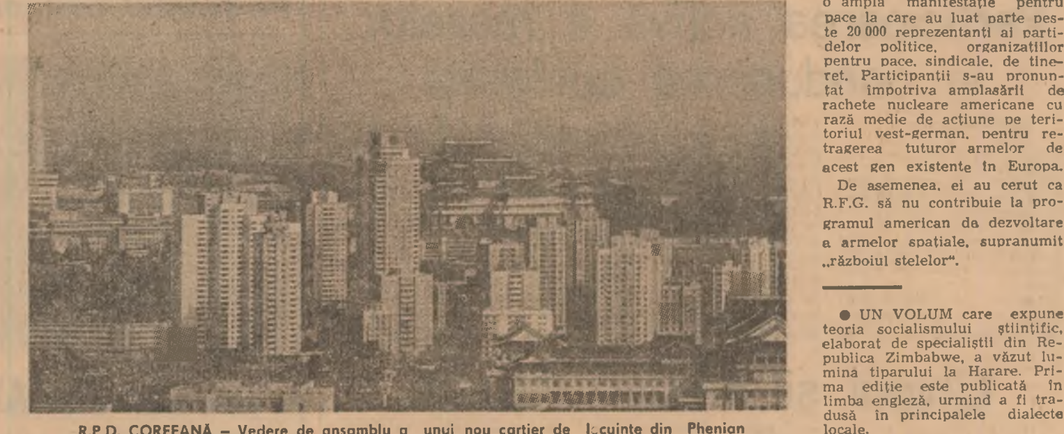
R.P.D. COREEANĂ — Vedere de ansamblu a unui nou cartier de locuințe din Phenix

rarea Palestinei (O.E.P.), care analizează situația din taberele de refugiați palestinieni din sudul Beirutului. Secretarul general al Ligii Arabe, Chedli Klibi, a cerut tuturor statelor arabe să-și asume responsabilitățile care le revin, pentru ca poporul palestinian să-și poată înapăi drepturile sale legitime. Fără rezolvarea problemei palestiniene a arătat el, nu se poate vorbi de o soluționare a situației din Orientul Mijlociu.