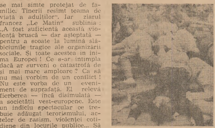
Scene dezolante, ca pe un cimp de bătălie