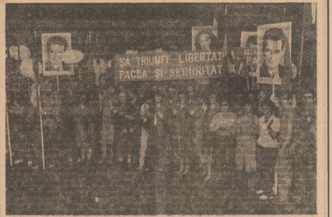
Participanții la adunarea adresată tovarășului NICOLAE CEAUȘESCU o telegramă în care se spune: În spiritul deplină aderență față de politica internă și externă a Partidului, oamenii muncii din această țară vă rugăm să vă asigurați că în această țară există o economie a Capitalului — în consens cu aspirațiile întregului nostru popor — și să vă asigurați că în această țară există o economie a Capitalului — în consens cu aspirațiile întregului nostru popor — și să vă asigurați că în această țară există o economie a Capitalului...

La întreprinderea de mașinării și agregate din București — care prin produsele sale este cunoscută în peste 25 de țări de pe toate continentele, ca mesager al paiei și voinței românilor de a calabera și trăi în bună înțelegere cu toate popoarele — peste 1500 de muncitori și cercetători din întreprindere, de la I.C.S.I.T.-Titan și întreprinderea de sticlărie au luat parte la un miting consacrat luptei pentru pace, împotriva înarmărilor.