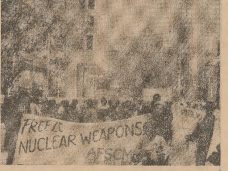
Locuitorii din Philadelphia, ca și din alte orașe ale S.U.A., au cerut guvernului, în cadrul unor demonstrații, „închetearea” armamentului atomic și adoptarea unor măsuri eficiente pentru a pune capăt cursei înarmării.

OTTAWA 13 (Agerpres). — Adunarea Legislativă a provinciei canadiene Manitoba a proclamat în unanimitate acest teritoriu zonă liberă de armă nucleară.