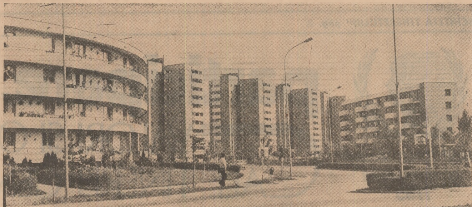
Brigada „Scintei tineretului” transmite:

ANUL XLI, SERIA II, Nr. 11 212 | 6 PAGINI - 50 BANI | LUNI, 17 Iunie 1985