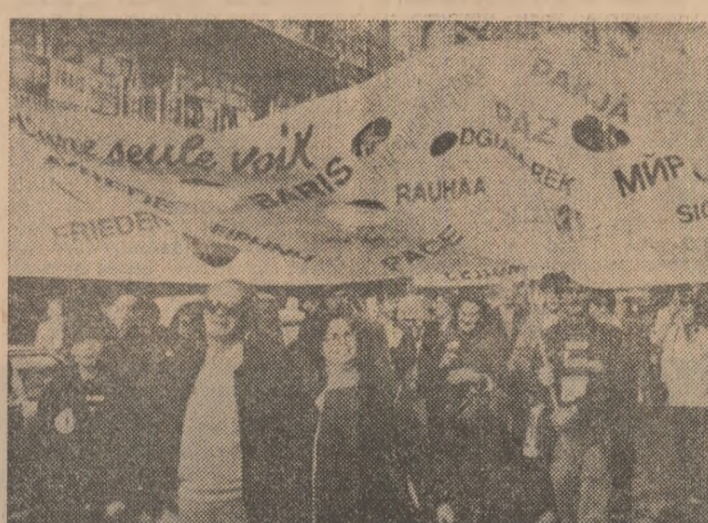
FRANȚA: cuvîntul „pace”, scris în mai multe limbi pe această pancartă purtată de demonstrații populare în onoarea lui Lenin și a păcii.

În cadrul discuțiilor care au avut loc cu acest prilej s-a evidențiat că relațiile de prietenie și colaborare dintre Uniunea Tineretului Comunist și Uniunea Tineretului Comunist Leninist cunosc o continuă dezvoltare și diversificare, pe baza legăturilor