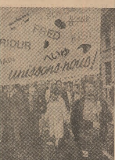
FRANȚA: cuvîntul „pace”, scris în mai multe limbi pe această pancartă purtată de demonstrații populare în onoarea lui Lenin și a păcii.

Referindu-se la o serie de probleme internaționale, vorbitorul a subliniat că, astăzi, nimic nu este mai important decît apararea păcii, asigurarea trăiniciei sale, astfel încît valorile inestimabile ale culturii umane să nu fie distruse de o conflagrație nucleară mondială pustitoare.