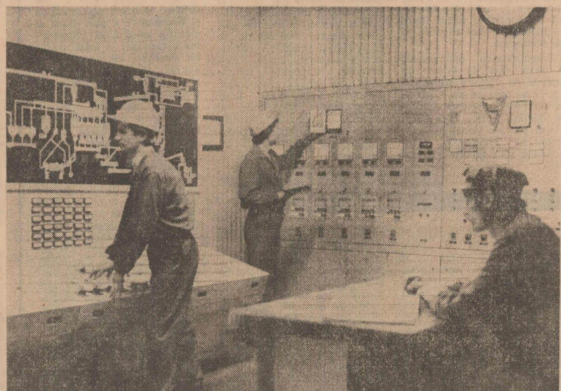
Rod al conjugării eforturilor specialiștilor timișoreni din cercetare, producție și învățămîntul superior

ADUNĂRI ȘI MITINGURI CONȘCIRTATE PĂCII ȘI DEZARMĂRII DESFĂȘURATE ÎN UNITĂȚI ECONOMICE ȘI INSTITUȚII (ÎN PAGINA A 5-A)