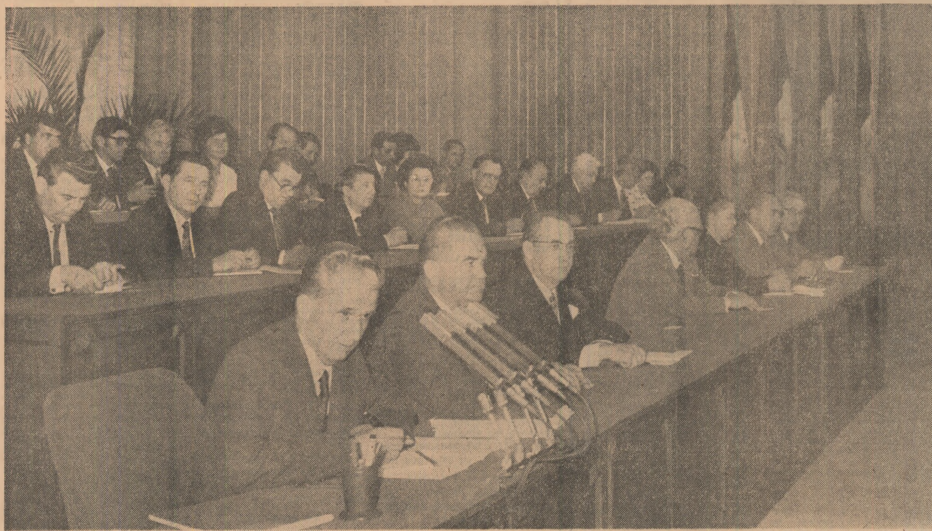
Sub președinția tovarășului Nicolae Ceaușescu, secretar general al Partidului Comunist Român, președintele Republicii Socialiste România, marți, 18 iunie, au continuat lucrările plenarei comune a Consiliului Național al Oamenilor Muncii din industrie, construcții, transporturi, circulația mărfurilor și finanțe și a Consiliului Suprem al Dezvoltării Economice și Sociale.

Tovarășul Nicolae Ceaușescu a fost întâmpinat, la sosirea în sală, cu deosebită căldură. Cei prezenți au aplaudat pentru partid și secretarul său general, care cu nestinsă dăruire revoluționară, cu fierbinte patriotism, conduce destinele României socialiste.