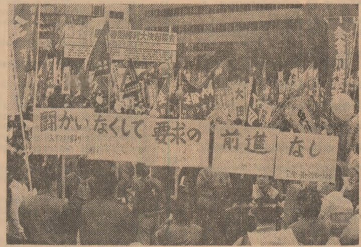
JAPONIA: Aspect din timpul unei ample demonstrații desfășurate la Tokio, împotriva cursei înarmării nucleare, la care au participat numeroși tineri

TOKIO 19 (Agerpres). — În ciuda vremii nefaste, această este țara mea” organizat în cadrul Expoziției mondiale tehnico-stiințifice „Expo-Tsukuba '85”, a fost prezentat un program dedicat României. Acesta a inclus date și imagini de interes istoric, geografic și turistic despre țara noastră, dansuri și muzică românească, precum și filmul documentar „Pădurea horezilor”. Desfășurat în cadrul centrului de ceremonii și spectacole al complexului expozițional Tsukuba, programul s-a bucurat de un deosebit succes în rândurile celor citorva mii de spectatori.