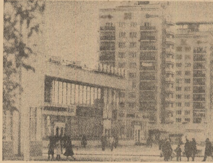
R. P. Mongolă: Clădiri noi, moderne la Ulan Bator, capitala țării