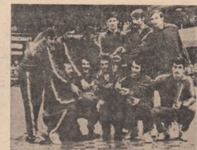
Handbaliștii români, cu trofeul de campioni ai lumii