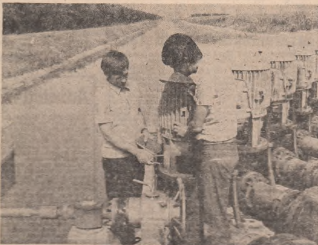
Ingaștile — o condiție a salvării culturilor