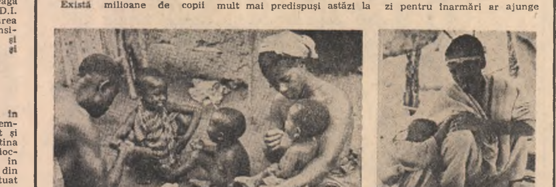
Bolile și foamea continuă să facă ravagi în rîndul copiilor din numeroase țări în curs de dezvoltare

Reducerea cheltuielilor bugetare destinate domeniilor sociale se repercutează, în S.U.A., în mod direct asupra asistenței medicale, hrînirii și îngrijirii copiilor, a ajutorului acordat familiilor sărace și copiilor acestora pentru școlarițare. Copiii americani sînt mult mai predispuși astăzi la