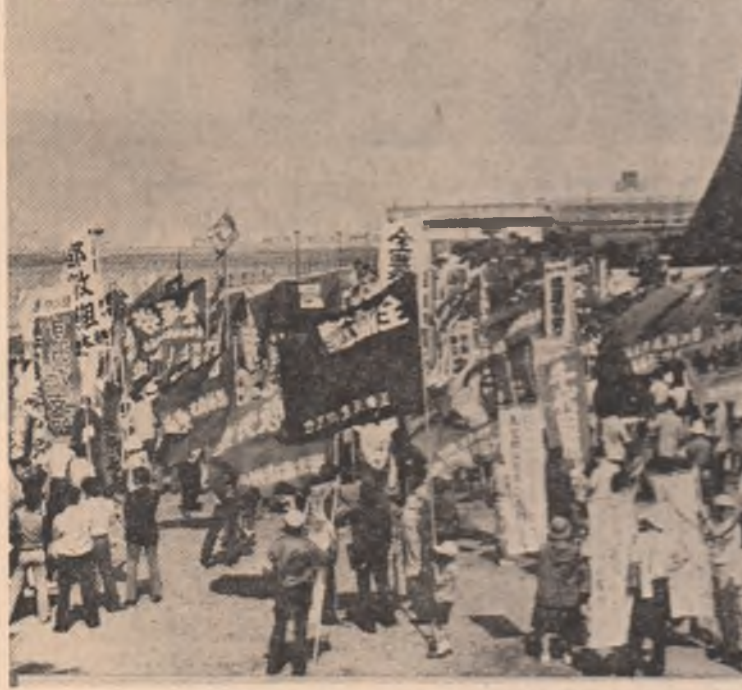
JAPONIA — Imagine din timpul unuia din marile mersuri ale păcii, desfășurate în contextul comemorării victimelor primelor bombardamente atomice, din 1945, de la Hiroshima și Nagasaki