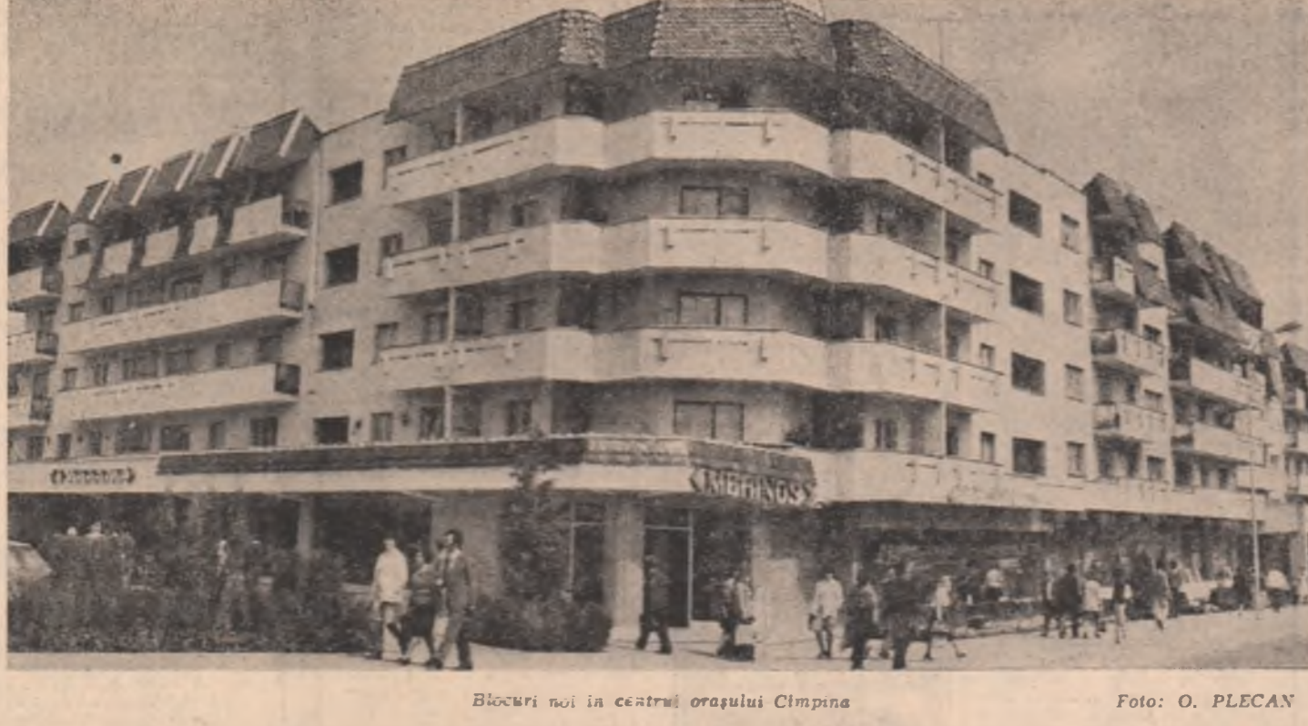
Blocuri noi în centrul orașului Cluj-Napoca.

Colectivele de oameni ai muncii din județul Iași au sărbătorit ziua de 23 August cu proslăvite realizări în muncă. Un număr de 37 de unități economice raportează, în aceste zile, începîndu-se depășirea prevederilor de plan la producția marfă industrială. Au fost puse suplimentar la dispoziția economiei naționale importante cantități de produse ale industriei electronice, confecției textile, nutrețurilor combinate, produse ale industriei alimentare și altele în valoare de peste 300 milioane lei. Cu un aport substanțial la obținerea acestor succese se chină întreprinderile din Sibotzia, întreprinderea de execuție și exploatarea lucrărilor de întreprindere funcționare, întreprinderea pentru industrializarea sticlei-de-zăhar din Tâmbăra, întreprinderea de ferite și fabrica de nutrețuri combinate din Uzicieni, precum și 14 colective de muncă laolaltă care și-au îndeplinit și depășit sarcinile de plan la exportul economic din județul Vrancea au exportat, de la începutul acestui an, suplimentar sarcinilor de plan, produse în valoare de peste 43 milioane lei. Beneficiarilor din peste 30 țări le-au fost livrate peste 1000 tone de produse de mecanică fină, produse de mecanică fină, mecanice, din lemn și materiale plastice, tricotate. Cu cele mai bune rezultate se prezintă la acest indicator colectivele întreprinderilor de scule și elemente hidraulice, metalurgice și de tricotaje din Focșani, întreprinderea chimică Mărășești.