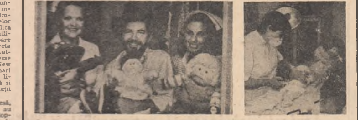
Păpuși de ultimă oră, din poliester și cirpe, în așteptarea unor „părinți adoptivi” cit mai bogați

voca sau agrava starea de malnutriție: anumiți paraziți intestinali absorb pînă la 25 la sută din aportul de calorii primit de un copil. În regiunile cele mai sărace ale lumii, copiii sînt bolnavi aproximativ o sută șezeci de zile pe an. Ei sînt în general victime a trei sau patru crize diareice, a patru sau cinci infecții respiratorii și a una sau mai multor maladii caracteristice copilăriei. Fiecare dintre aceste afecțiuni provoacă o scădere în greutate. Rujolea, de exem-