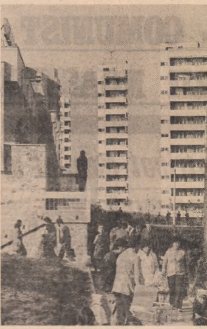
Municipal S.J. Gheorghe