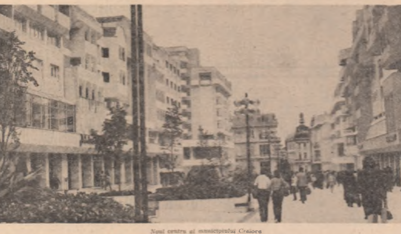
Noul centru al municipiului Craiova

(în pagina a 2-a, opiniile oamenilor muncii)