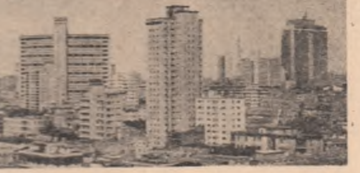
Nu dimensiuni urbane în Havana, capitala Republicii Cuba