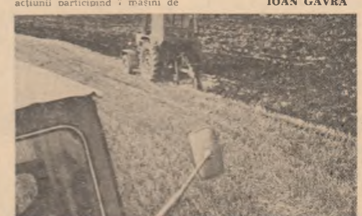
Arăturile adînci — o lucrare hotărîtoare pentru viitoarele recolte

La C.A.P. Sătmăreș, de exemplu, priciperea și hărnicia cooperativilor nu se dezmint.