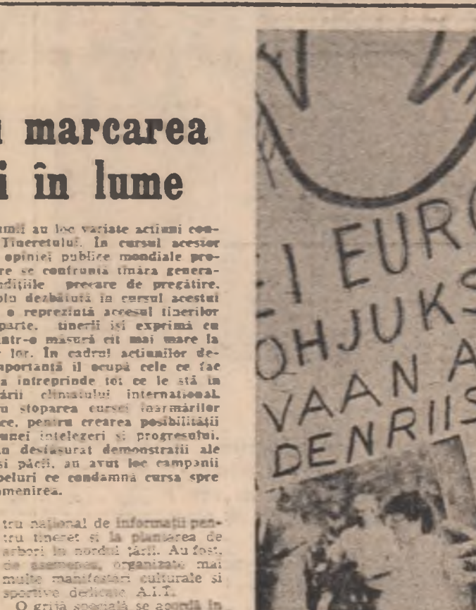
Aspect din timpul uneia din numeroasele demonstrații pentru pace ale tinerilor finlandezi desfășurate la Helsinki. Pe pancartă se află înscris „Nu, rachetelor în Europa”, „Da, dezarmării”

Un mare număr de activități consacrate Anului Internațional al Tinereții se desfășoară în țările în curs de dezvoltare. Ele au drept obiectiv principal promovarea și dezvoltarea tinerei generații și asigurarea condițiilor necesare pentru o bună formare a tinereții. În Danemarca se pune un accent deosebit pe necesitatea menținerii problemelor tinereții în atenția opiniei publice și după încheierea conferinței la Anul Internațional al Tinereții. Formarea tinereții cadre — obiectiv prioritar în țările în curs de dezvoltare Un mare număr de activități consacrate Anului Internațional al Tinereții se desfășoară în țările în curs de dezvoltare. Ele au drept obiectiv principal promovarea și dezvoltarea tinerei generații și asigurarea condițiilor necesare pentru o bună formare a tinereții. În Danemarca se pune un accent deosebit pe necesitatea menținerii problemelor tinereții în atenția opiniei publice și după încheierea conferinței la Anul Internațional al Tinereții. Formarea tinereții cadre — obiectiv prioritar în țările în curs de dezvoltare