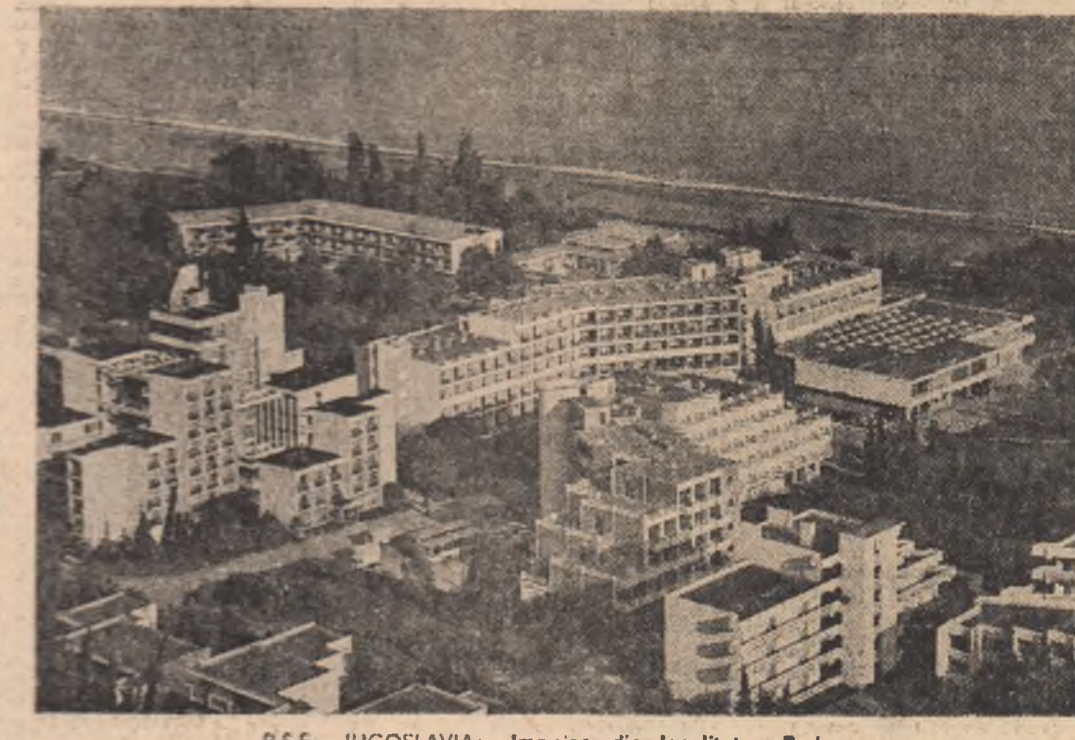
R.S.F. IUGOSLAVIA: Imagine din localitatea Budva

Boha, dar au fost împiedicați de poliție. Tot în zona Capetown s-a înregistrat o altă acțiune de protest, în care au participat peste 2.000 de persoane, ce s-au îndreptat spre închisoarea de la Robben, unde este încarcerat Nelson Mandela — lider al Congresului Național African — condamnat la închisoare de către guvernul minoritar de la Pretoria. Intensificîndu-se acțiunile de protest, regimul minoritar este silit să mobilizeze importante forțe polițienești și militare — însoțite de muniții blindate — care au fost aruncate în direcția grupurilor de studenți pentru împiedicarea demonstrațiilor. Numai în ultimele 24 de ore, poliția a intervenit în cadrul unor demonstrații la fostul palat al guvernului și a provocat moartea a 15 persoane și răniți a peste 50. Au fost organizate și demonstrații, numărate zecile.