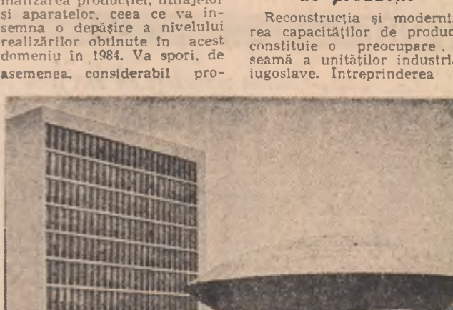
R.S. CEHOSLOVACA — Imagine a Centrului universitar de la Nitro