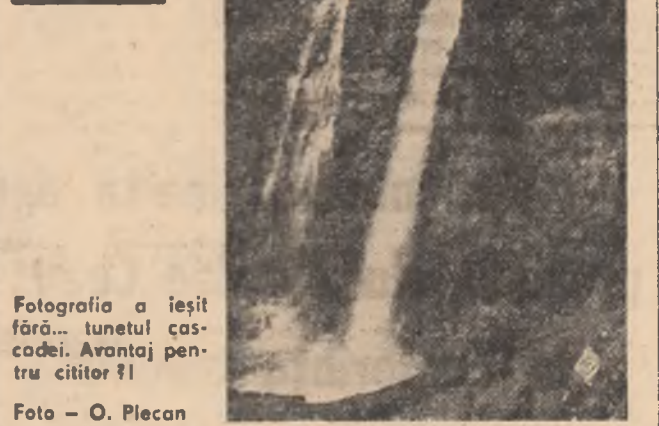
Fotografia a ieșit fără... tunetul cascadei. Avantaj pentru cititor!