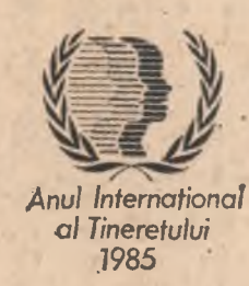
Anul Internațional al Tineretului 1985

Generoasele idei, izvorite dintr-un autentic umanism revoluționar, cuprinse în Mesajul tovarășului Nicolae Ceaușescu, președintelui Republicii Socialiste România, adresat participanților la Conferința mondială a comitetelor naționale pentru A.I.T., continuă să polarizeze interesul profund al celor prezenți la această importantă manifestare. Declarațiile pe care le publicăm astăzi relevă largă recunoaștere a rolului activ al României, al președintelui Nicolae Ceaușescu, în promovarea fondului de opțiuni și aspirații vitale ale tinerii generații contemporane, semnificativă deosebită a inițiativei țării noastre vizind proclamarea Anului Internațional al Tineretului, sub semnificativă și mobilizatoare deviză „Participare, Dezvoltare, Pace”.