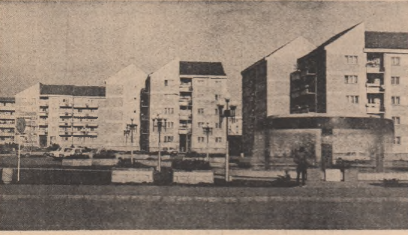
Imagine din Bistrița