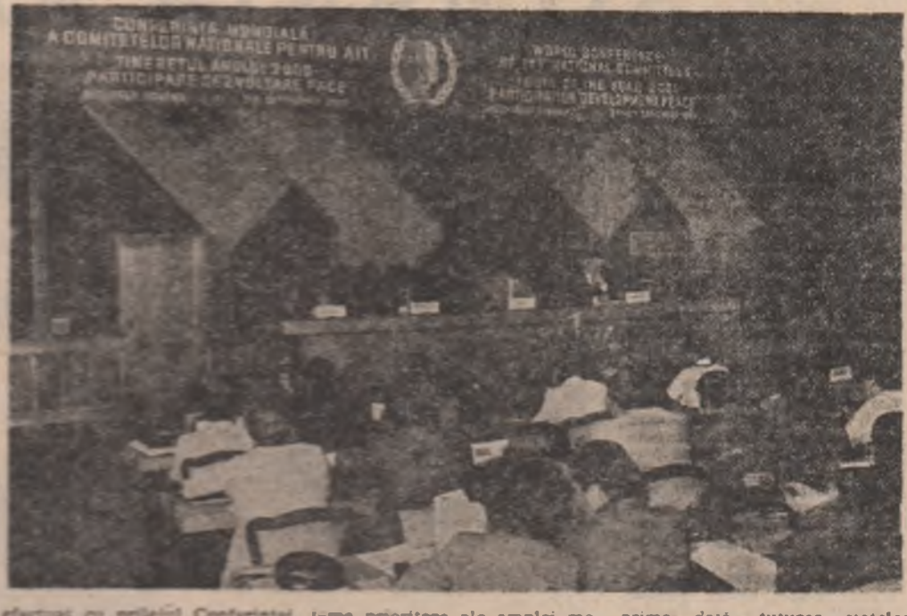
COMITETUL NAȚIONAL AL TINERETULUI ROMÂNIA. ÎNCHIEIEREA CONFERINȚEI MONDIALE A COMITETELOR NAȚIONALE PENTRU ANUL INTERNAȚIONAL AL TINERETULUI. ÎNCHIEIEREA CONFERINȚEI MONDIALE A COMITETELOR NAȚIONALE PENTRU ANUL INTERNAȚIONAL AL TINERETULUI.

În cadrul sesiunii de lucru, participanții au procedat la un schimb de opinii și experiență privind înfăptuirea programelor de participare la Anul Internațional al Tineretului, adoptarea unor politici naționale referitoare la viața și activitatea tineretului, înțelegerea și susținerea cooperării între tinerii din diferite țări, în vederea realizării obiectivelor și a scopurilor stabilite în cadrul programelor de participare la Anul Internațional al Tineretului.