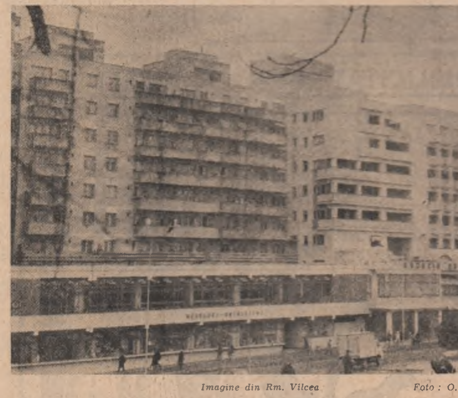
Imagine din Rm. Vilcea.