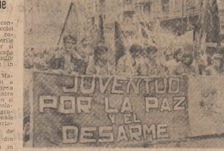
Tinerii spanioli demonstrează pentru pace și dezarmare, pentru un viitor sigur al umanității

WASHINGTON II (Agerpres). — Numeroși oameni de știință americani au declarat că inițiativa strategică americană, cunoscută sub numele de „razboul stelelor”, reprezintă „o ficțiune științifică” și „o colosală risipă de bani”. După cum relevă agenția Associated Press, pe o petiție semnată de numeroși oameni de știință de