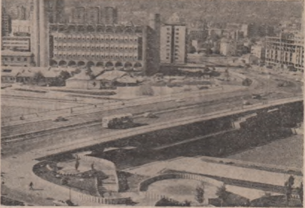
R.S.F. JUGOSLAVIA: Ritmuri arhitectonice în localitatea Skopje

ROMA 16 (Agerpres). — Ziarul „L'Unita”, organ de