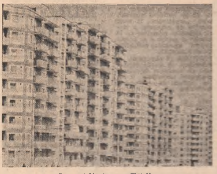
Cartierul Mădăraș - Cluj-Napoca