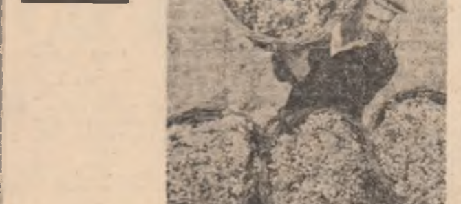
Podobele de chihlimbor ale toamnei