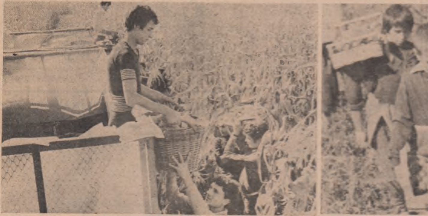
E ora plină și surie a porumbilor