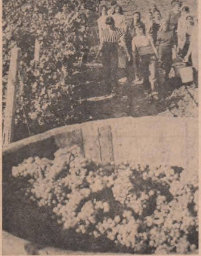
De neconceput poezia toamnei fără struguri. De neconceput fără tineri