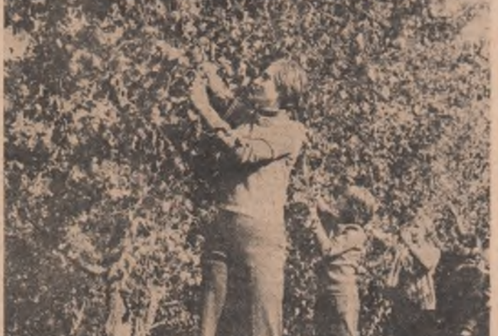
Tinere, nu numai livezile!