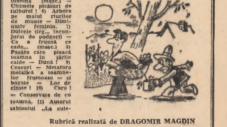
Rubrică realizată de DRAGOMIR MAGDIN