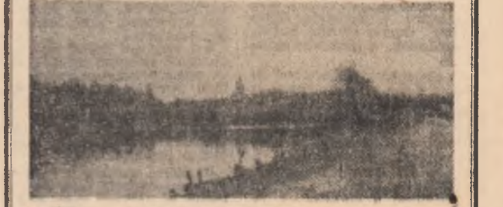
„Undeva în toamnă iar se pierde drumul Pe-ntînderi de aur, pe sub zări de-aramă...”