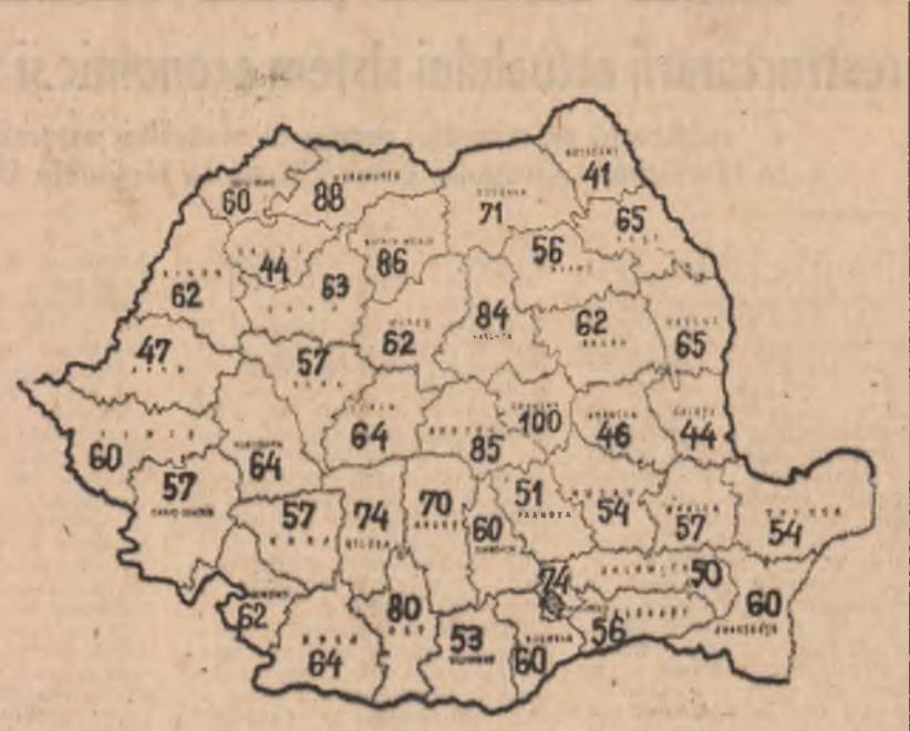
Stadiul însămînțării de toamnă la data de 1 octombrie 1985, în procente, total sector socialist