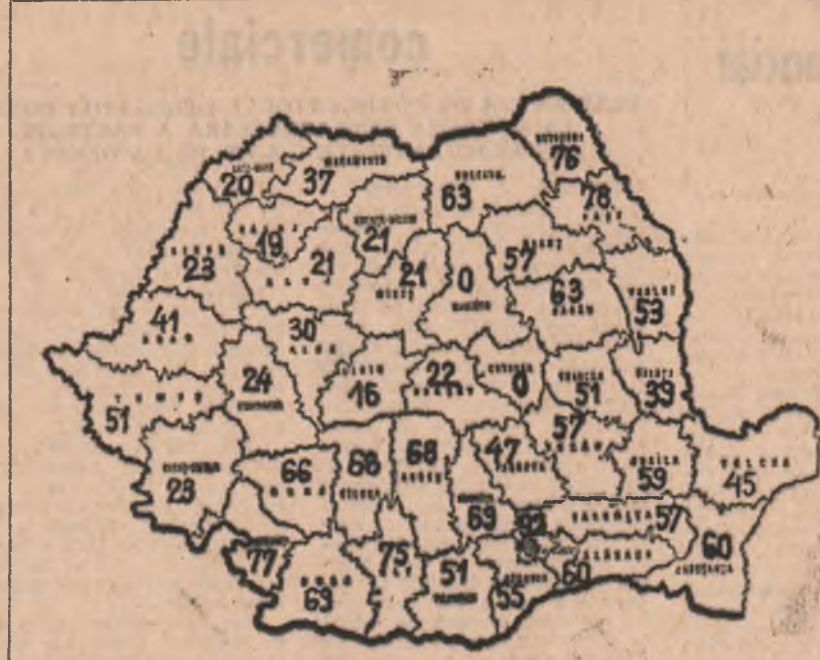
Situația recoltării porumbului la data de 1 octombrie 1985, în procente, total sector socialist

zare ca nimic din recoltă să nu se irosească. Astfel, tinerii sînt concentrați în podgorii la recoltatul strugurilor, în livezi la recoltat și sortat fructe, în unitățile I.A.S. și C.A.P. din zona de sud a județului — Măicânești, Clodrești, Vulturi, Nănești — la depănșat porumb, precum și la recoltat și sortat legume. La ora actuală sînt prezente pe ogoare peste 30.000 de tineri. Pretutindeni se acționează cu mult spor, atenție maximă fiind acordată calității lucrărilor. La I.A.S. Cotești sînt prezente în podgorii peste 1.500 de elevi de la Liceul Industrial nr. 1 și Liceul Unirea din