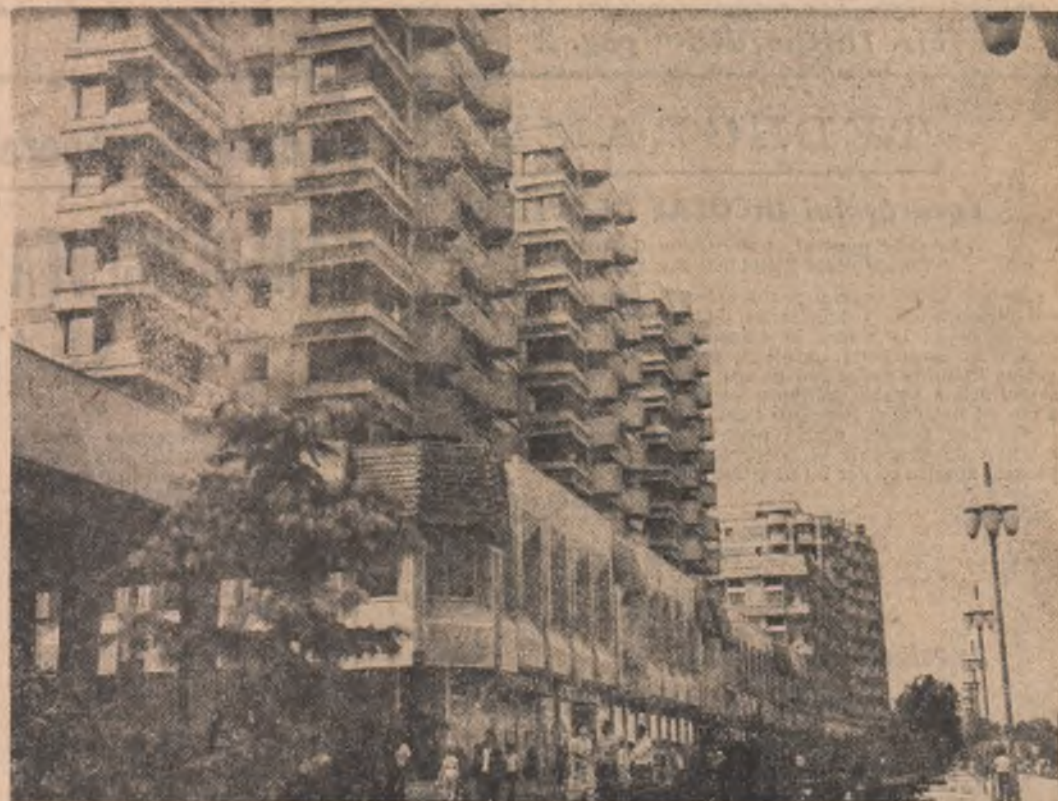
Imagine din municipiul Bacău