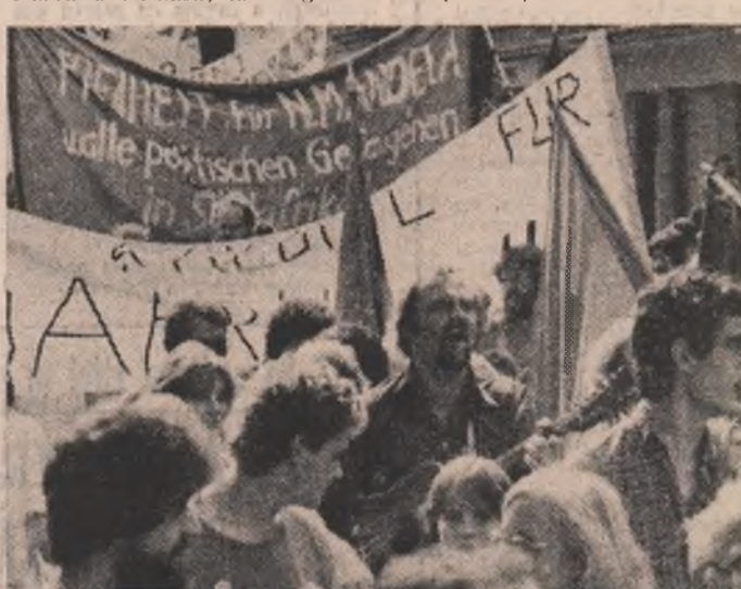
Imagine din timpul unei ample demonstrații desfășurate recent la Bonn sub deviza "Solidaritate împotriva rasismului - Libertate Africii de Sud și Namibiei"

S-a dezbătut opinia, formulată în special de reprezentanții țărilor mici și mijlocii, nealiniate, în curs de dezvoltare, că actuala sesiune aniversară se cere folosită în primul rând pentru reafirmarea hotărârii, care stă în fața organizației mondiale tuturor statelor membre la principiile și obiectivele Cartei O.N.U., a angajamentului lor de a se respecta în toate sferile de activitate și de a-și realiza în mod efectiv angajamentele față de scopurile și obiectivele actualei încercări periculoase din viața internațională, la reluarea cursului pozitiv al destinerii, la democratizarea raporturilor interstatuale, la rezolvarea dezarmării, la stingerea