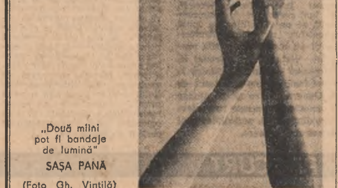
„Două mîni pot fi bandaje de lumină” SASA PANĂ