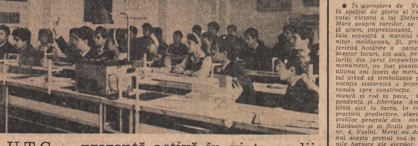
● În apropiere de Vaslui, în spațiul de glorie al cunoștințelor victoriei a lui Ștefan cel Mare, prințul Ștefan cel Mare, statuia ecrusă a marelui domnitor moldovean. Sî, print-ofericită hotărîre a oamenilor acestor locuri, noi aici, pe dealurile din jur, am construit un monument, un fost plantat în ultimii ani livezi de meri, gestul vînd să simbolizeze parcă vocația statornică a poporului român seral constructiv, spre mîncă și roșii în pace, independentă de orice. Am înțeles aici la lucru, în cadrul practicii productive, elevii ai școlilor generale din comuna Băcăușani și ai Școlii generale nr. 4, Vaslui. Merii au dat a-nă această primă roșie și miile harnice ale elevilor, dau un ajutor prețios lucrătorilor fermei pomicele Băcăușani a I.A.S. Vaslui, cum se numește, prozică, poate, această livadă.