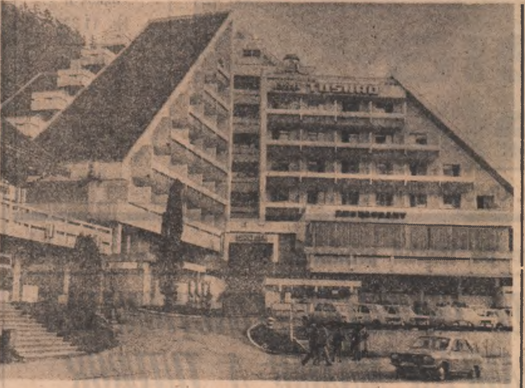
Hotelul Tușnad din stațiunea Tușnad-Băi