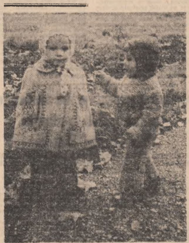
Toamna, iada își numără... boboci!