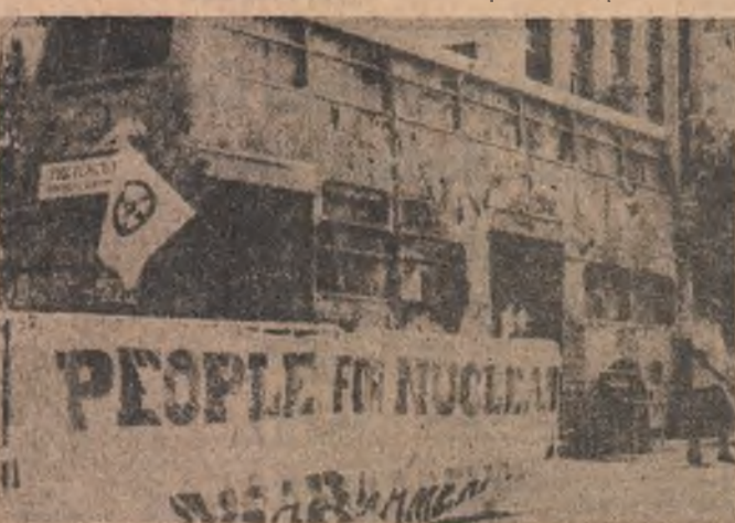
Aproximativ 1000 de persoane au călătorit, zilnic, la Sidney, cu acest „Autobuz pentru Pace”, demonstrînd și în felul acesta dorința fierbinte a oamenilor de înfruntare a dezarmării și păcii.

BAGDAD 11 (Agerpres) — La 16 noiembrie va avea loc la Bagdad o reuniune extraordinară a Uniunii parlamentare arabe, care va analiza raidul de urgență al Israelului asupra cartierului general al Organizației pentru Eliberarea Palestinei din Tunisia.