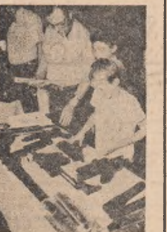
niștii, Camorra siciliană, grupări neonaziste vest-europene etc. Arme dezgizate în ajutoare „umanitare” includ: mine de teren, rachete antitanc, arme automate, mortiere și chiar... tunuri!

— Destinația acestor arme: traficanții de droguri din America de Sud, antisand-