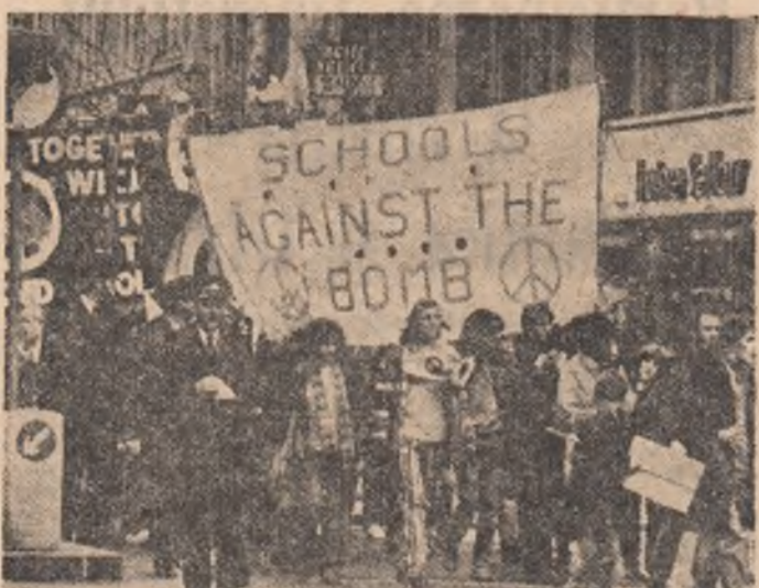
MAREA BRITANIE — Demonstrație a tineretului britanic împotriva cursei înarmărilor

NAȚIUNILE UNITE 26 (Agerpres). — Secretarul general al O.N.U., Javier Perez de Cuellar, a condamnat într-o declarație difuzată la sediul O.N.U. din New York — acțiunea piraterescă de deturmare a avionului egiptean „Boeing-737”, ce zbura pe ruta Atena — Cairo. Tragedia de felul celui legat de deturmare a avionului companiei „Egyptair” reafirmă necesitatea ca guvernele să desfășoare efor-