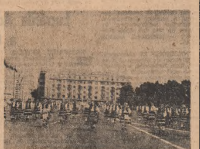
„Stinga-unu, dreapta-doi, cum e jocul pe la noi...”