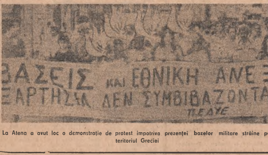
La Atena a avut loc o demonstrație de protest împotriva prezenței bazelor militare străine pe teritoriul Greciei

Sub devisa „Nu — repetării tragediei de la Hiroshima!” în