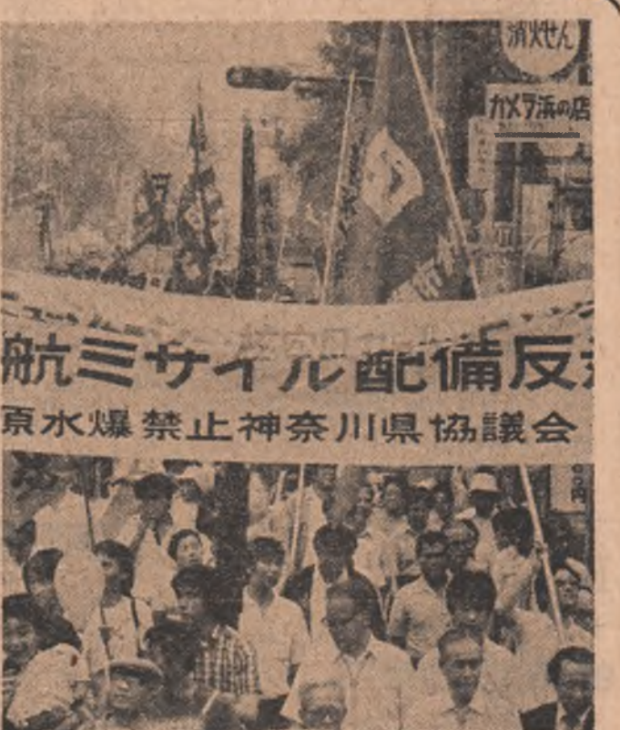
Numerosi tineri niponi au participat, în orașul Yokohama, la o demonstrație de protest împotriva escaladării cursei înarmărilor nucleare

În ce privește modalitatea de soluționare a acestei probleme, în contactele preliminare, Israelul s-a pronunțat pentru negocieri directe, iar Egiptul a propus ca discuțiile să se desfășoare sub arbitraj internațional.