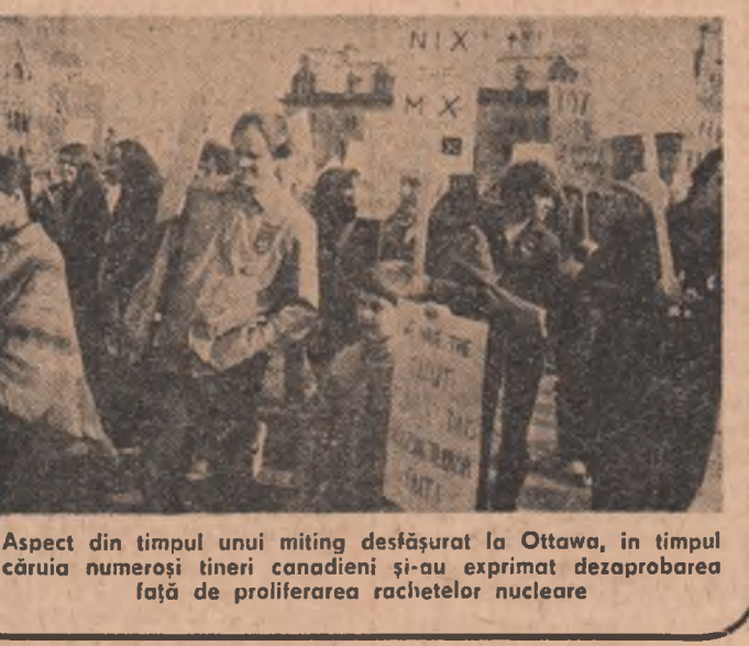
Aspect din timpul unui miting desfășurat la Ottawa, în timpul căruia numeroși tineri canadieni și-au exprimat dezaprobarea față de proliferarea rachetelor nucleare