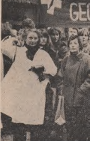
La inițiativa medicilor din mai multe orașe din R.F.G., un mare miting pe tema „Avertismentul cadrelor medicale față de pericolul unui război nuclear”...