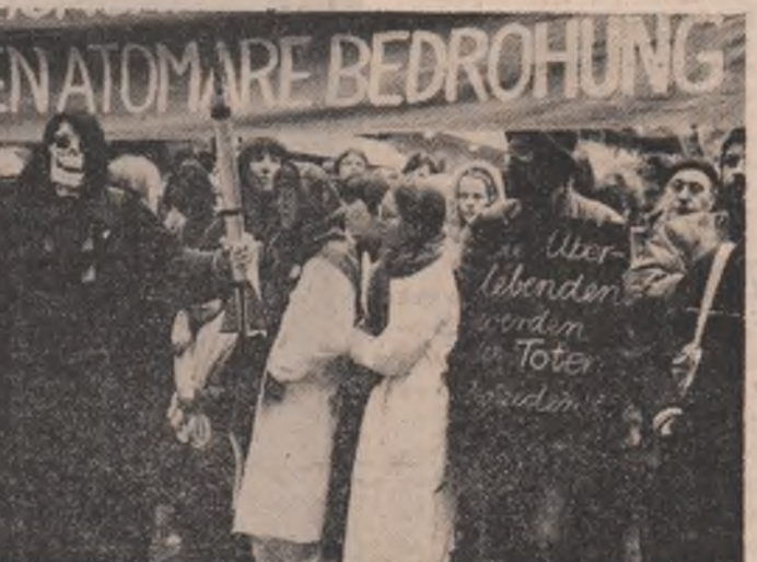
La inițiativa medicilor din mai multe orașe din R.F.G., un mare miting pe tema „Avertismentul cadrelor medicale față de pericolul unui război nuclear”...