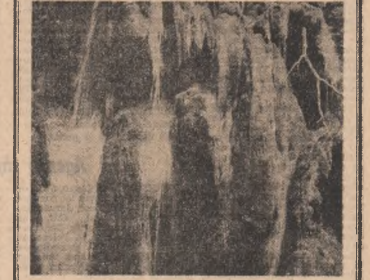
Miraculoasa jantezie a naturii