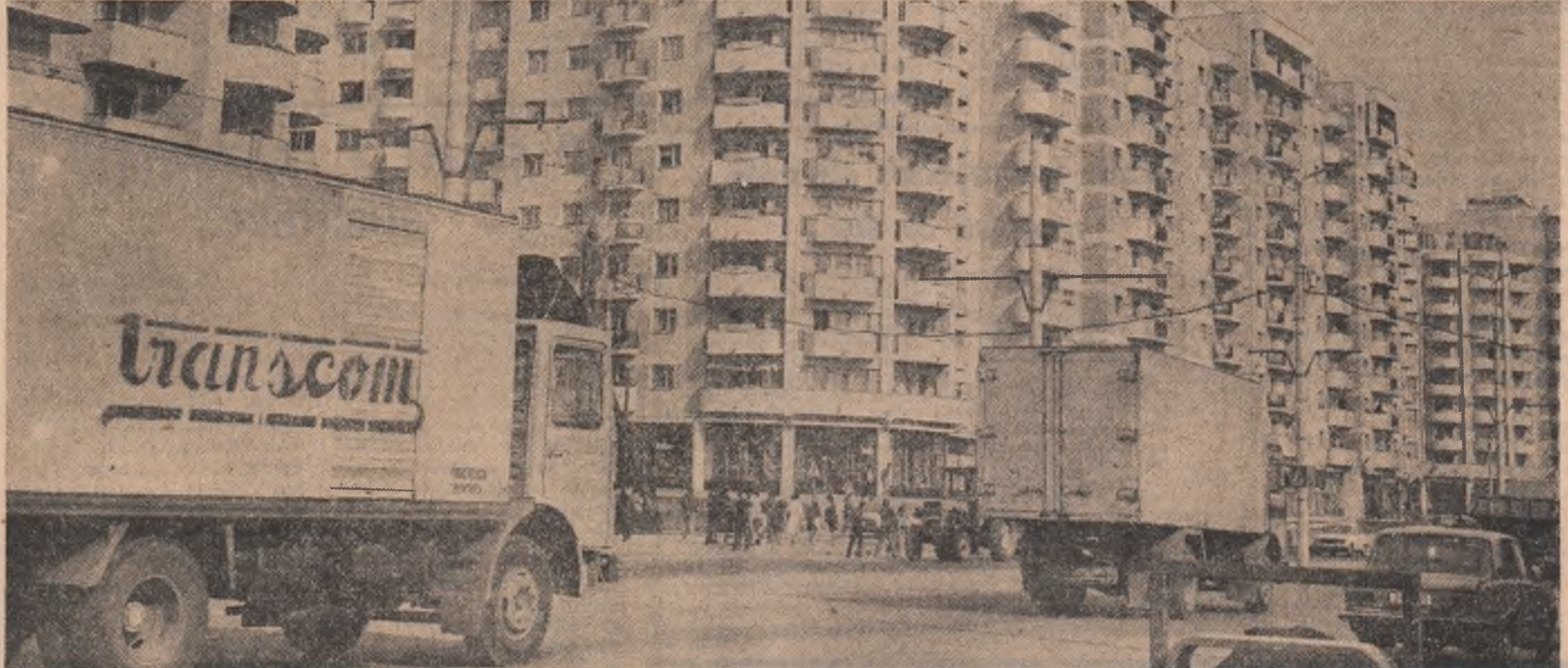
Crîngăși — unul dintre cele mai noi cartiere ale Capitalei

La Combinatul de îngrășăminte chimice „Azomureș” din Tg. Mureș se depun eforturi susținute pentru recuperarea resurselor energetice secundare din combinat și utilizarea acestora inclusiv la încălzirea unor locuințe. Ca urmare, prin captarea și transportul aburului și apei calde către noul ansamblu de locuințe din apropierea combinatului, se asigură încălzirea a 160 de apartamente, economiile realizate pe această cale însumînd peste 700 mc gaz metan pe oră. Specialiștii mureșeni au luat în studiu și alte rezerve de energie secundară, ce urmează a fi revalorizate în procesele tehnologice de bază, și pentru alimentarea cu agent termic și apă caldă a unui nou ansamblu de locuințe.