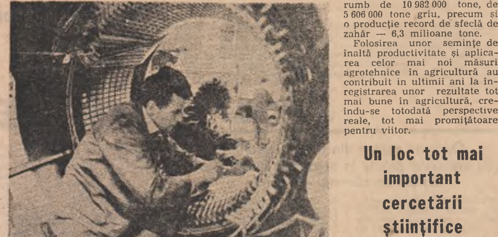
Dezvoltarea continuă a forțelor de producție...