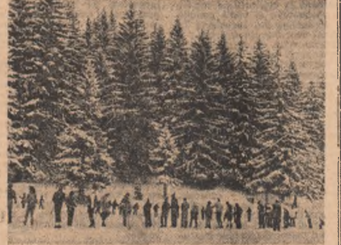
Chemarea muntelui