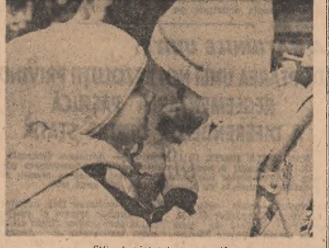
Știi să păstrezi un secret?