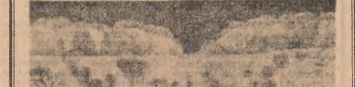
Iarna văzută de un... nativ.