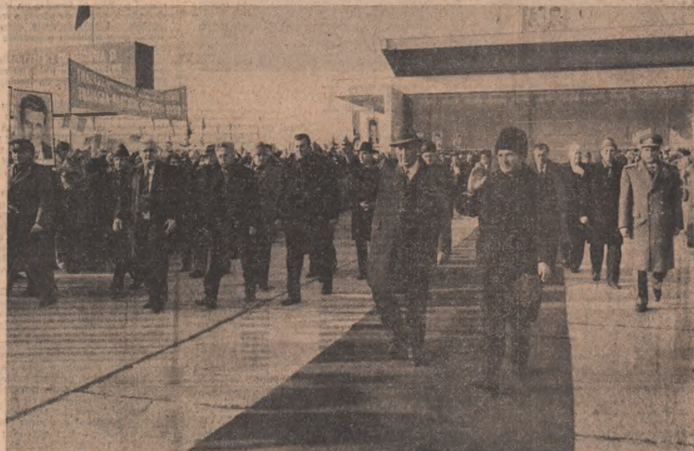
salve de artilerie. În continuare, tovarășii Nicolae Ceaușescu și Todor Jivkov au trecut în revistă garda de onoare. Conducătorul partidului și

O gardă militară a prezentat onorul. Au fost intonate imnurile de stat ale Republicii Populare Bulgaria și Republicii Socialiste România, în timp ce, în semn de salut, au fost trase 21