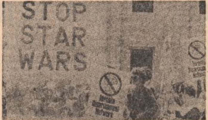
Aspect din timpul unei demonstrații antinucleară desfășurate la Toronto, în Canada, împotriva extinderii cursei înarmărilor în Cosmos

În cadrul mitingului care a urmat demonstrației, vorbitorii au subliniat că fondurile care se înrosc în prezent pentru înarmări ar trebui folosite pentru lichidarea somajului, pentru realizarea unor măsuri sociale în beneficiul pașturilor largi ale populației.