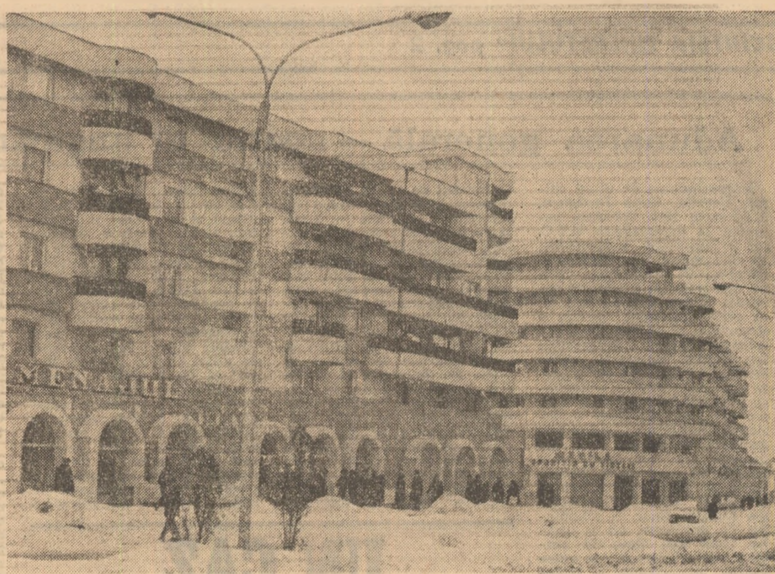
Municipiul Buzău

AURELIA BACIU, cooperatoare, C.A.P. Voslobeni, județul Harghita (Continuare în pag. a 11-a)