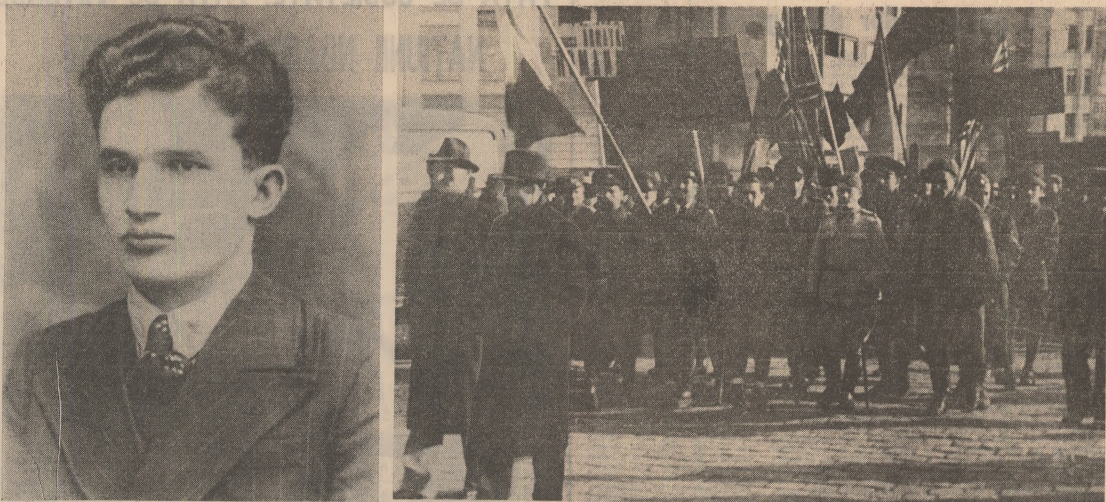
Tovarășul Nicolae Ceaușescu în anul 1939