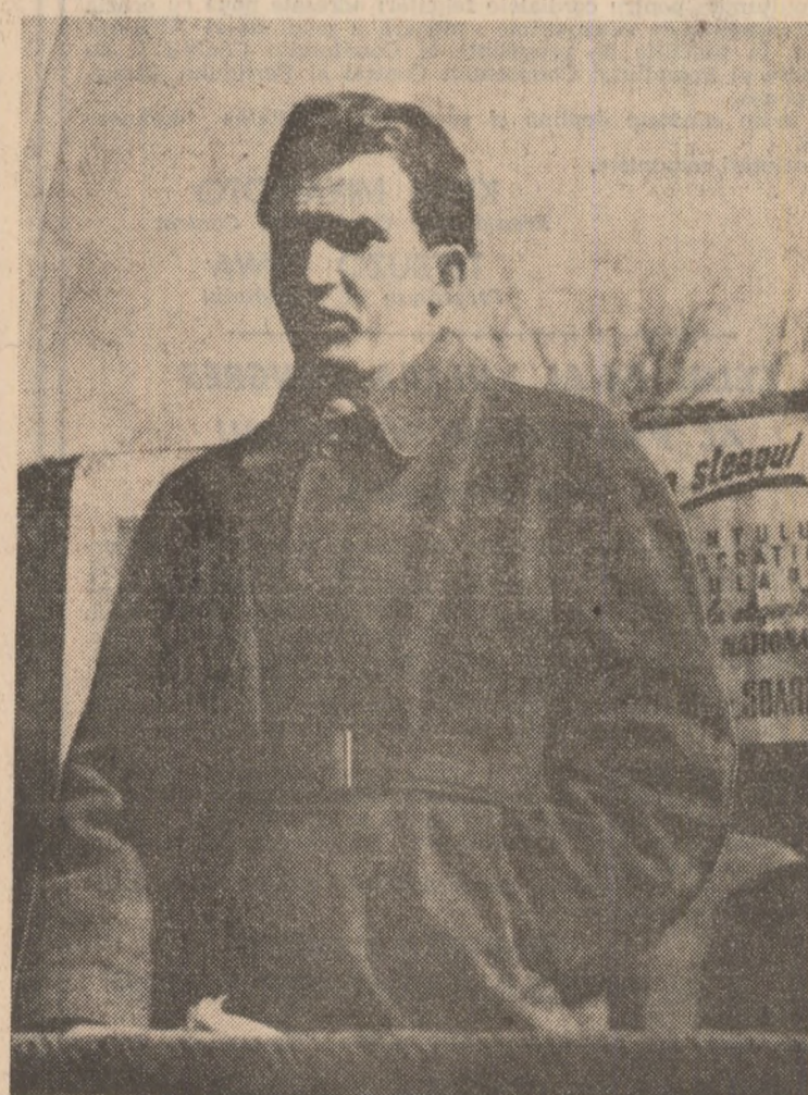
Tovarășul Nicolae Ceaușescu vorbind la un miting electoral organizat la Slatina, noiembrie 1946