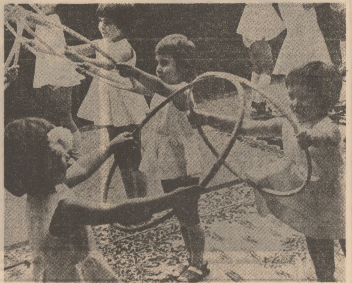
(Urmare din pag. 1)

avea copii constituie cea mai frumoasă datorie faţă de patrie, faţă de viitorul ei care nu este altceva decât vîrsta de mîine a acestor copii.