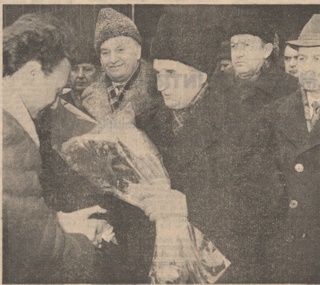
Întreprinderea de țevi Republica.

În continuare, tovarășul Nicolae Ceaușescu a vizitat