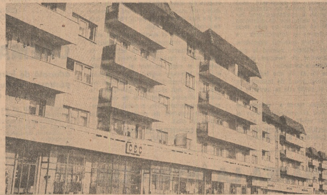
Băicoi, județul Prahova