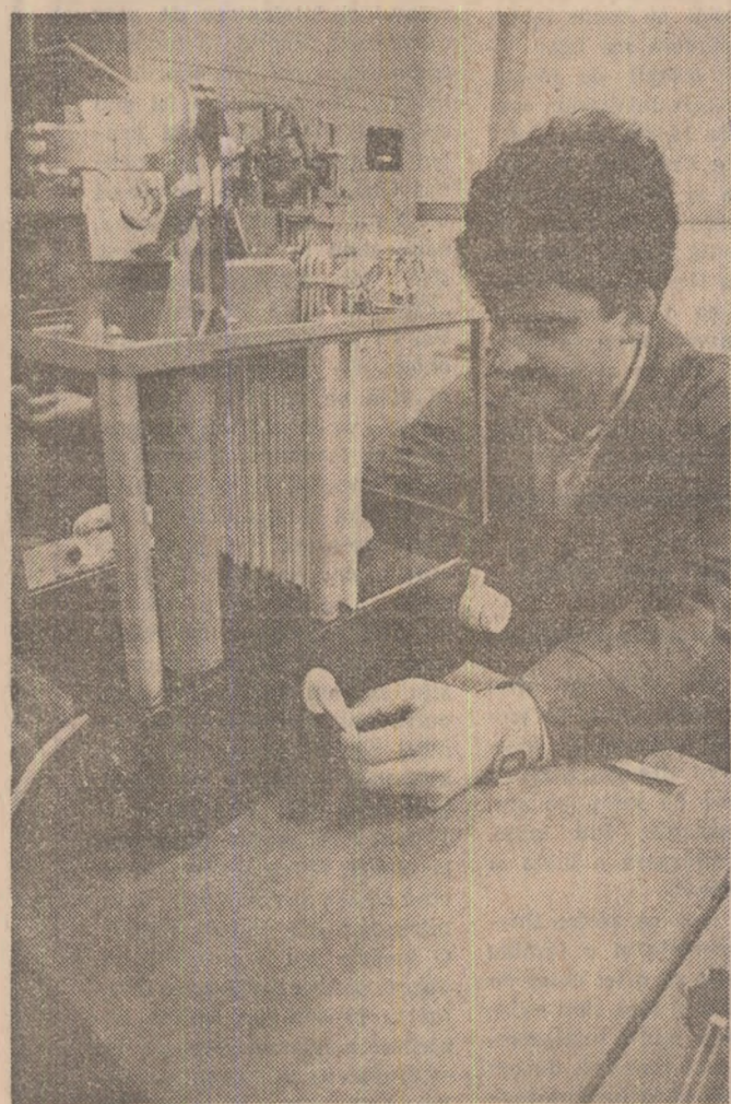
Întreprinderea „Balanta” Sibiu