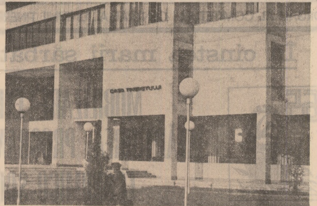
Casa Științei și Tehnicii din municipiul Turnu-Severin

*) NICOLAE IORGA — „Locul românilor în istoria universală”, Editura Științifică și Enciclopedică, București, 1985.