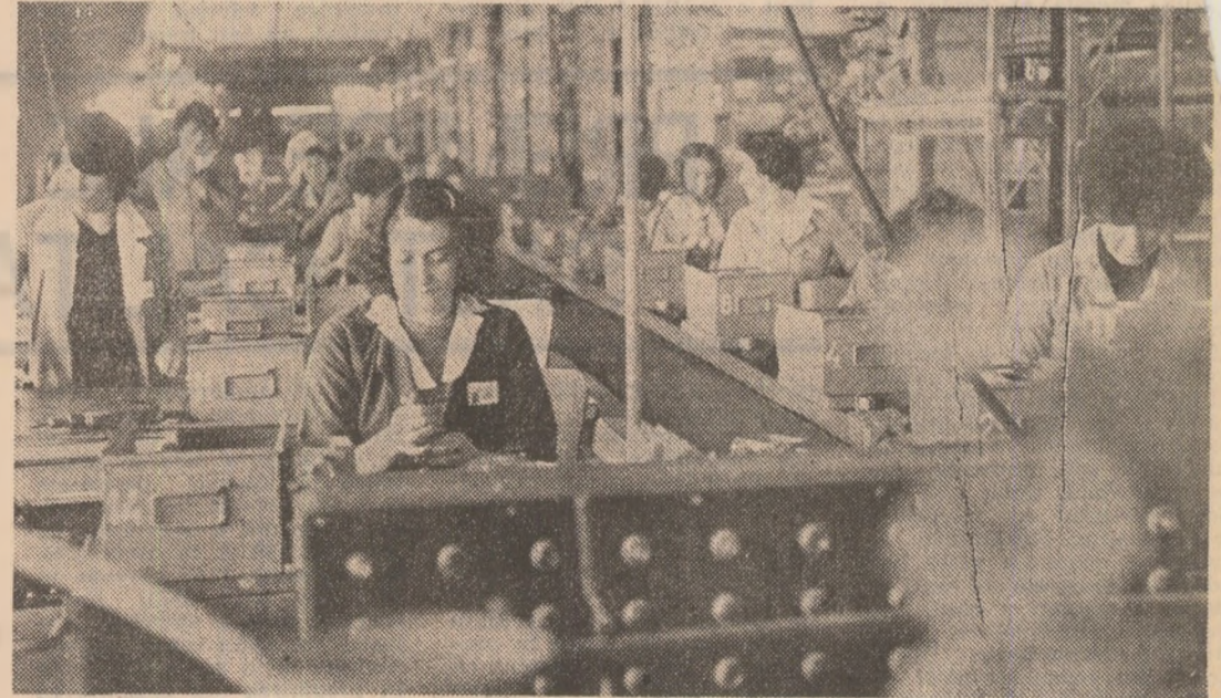
Întreprinderea „Electrocontact” din Botoșani

Desigur, nu am epuizat întregul „arsenal” în fabricația pentru export. Și aici, ca în altele ale întreprinderii, s-a trecut la evidențierea unor posibilități de perfecționare a organizării muncii, de modernizare a proceselor de producție. În fapt, se acționează pe toate planurile ce pot hotărâși sau influența în măsură mai mare ori mai mică la realizarea producției la export, și nu vorbim numai de tractoare, ci și de mașini agricole, pluguri, remorci cisterne, etc. Cunoștințele responsabile de întinderea pentru activitatea acestui harnic colectiv craiovean, cel al întreprinderii de tractoare și mașini agricole.