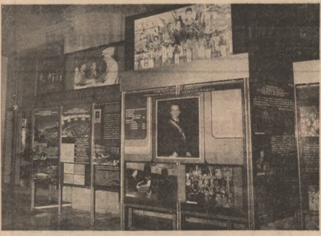
lica partidului și statului nostru. față de grija părintească ce le-o poartă tovarășul Nicolae Ceaușescu, secretar general al partidului.

ÎNTREGUL POPOR, TINARA GENERAȚIE A PATRIEI, ÎNTR-O DEPLINĂ ȘI INDESTRUCTIBILĂ UNITATE DE GÎND ȘI FAPTĂ ÎN JURUL PARTIDULUI, AL SECRETARULUI SĂU GENERAL, ADUC UN FIERBINTE ȘI ÎNSUFLEȚITOR OMAGIU LA MAREA NOASTRĂ SĂRBĂTOARE