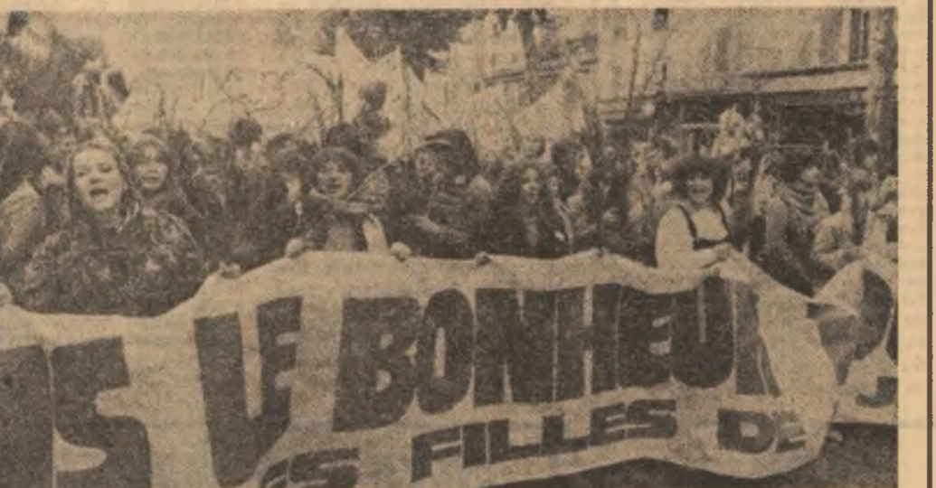
Un impresionant miting al tinerilor francezi, care se pronunță pentru încetarea proliferării de arme nucleare

În cursul anului trecut au fost vînate aproximativ 5 milioane de canguri, cifră care depășește de trei ori numărul aprobărilor date de autorități.