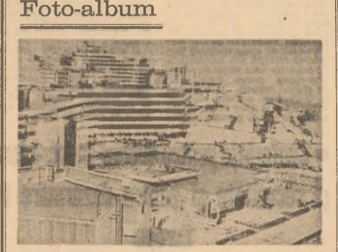
Un traseu pentru vacanța care se apropie. Soarele, marea și litoralul vă așteaptă...