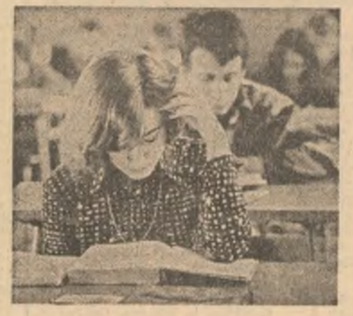
Insemnări din R.P. Polonă

mare accent se pune pe sporirea calității programului de învățămînt, ridicarea nivelului de pregătire a celor cuprinși în sistemul de instruire.