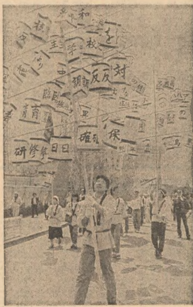
Tineri japonezi manifestînd, la Tokio, împotriva escaladării cursei înarmărilor, pentru reducerea cheltuielilor militare

Într-o declarație dată publicității la Roma, Universitatea din acest oraș a făcut un apel la instaurarea unei păci durabile în Marea Mediterană.