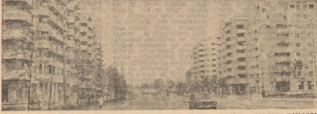
Calea 13 Septembrie — București

„Desigur, preocupările noastre urmăresc, în continuare, îmbunătățirea procesului educațional. Lată, bunăoară, realizăm periodic lecții deschise cu participarea părinților, organizînd discuții cu învățătorii care li vor prelua la școală pe acești copii. Între dorința de a păstra neștirbit farmecul acestei vîrste irepetabile și necesitatea de a-i pregăti cît mai bine pentru școală, încercăm și, cred eu, reușim să realizăm un echilibru pe care-l arăta roadele în modul în care evoluează mai tîrziu acești copii”, spunea Stela Jalobă, demonstrînd că, nu înțelegînd, acest colectiv se bucură de un binemeritat prestigiu între unitățile școlare de profil.