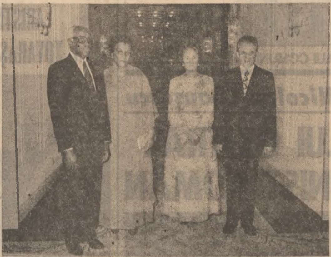
C.C. al P.C.R., secretari ai Comitetului Central al partidului, membri ai Consiliului de Stat și ai guvernului. Au luat parte persoane oficiale care îl însoțesc pe conducătorul partidului și statului din Capul Verde în țara noastră.