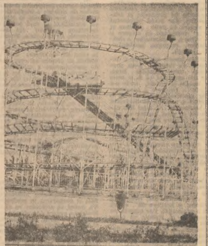
In Parcul Tineretului