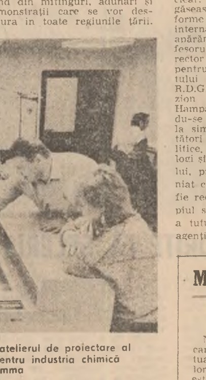
R. D. GERMANIA: Imagine din atelierul de proiectare al Combinatului de echipament pentru industria chimică Leipzig-Grimmo