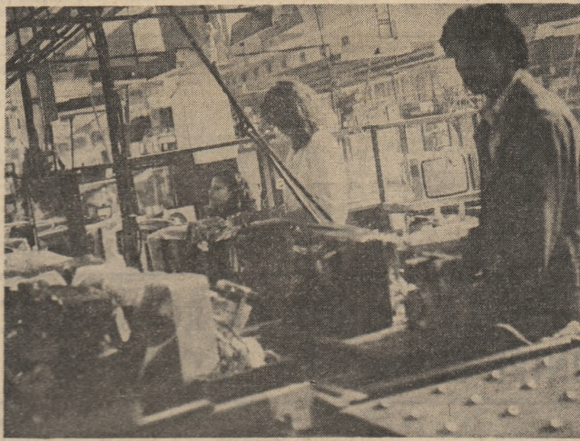
Întreprinderea de Cinescoape București

1986, ca prim an al cincinalului 1986—1990, în care va fi înfăptuită noua revoluție tehnico-stimulată, este un an notabil pentru întreaga noastră economie, marcat de profunde transformări. Reorganizarea și modernizarea proceselor productive, declanșate printr-un amplu program la inițiativa secretarului general al partidului, tovarășul Nicolae Ceaușescu, impune ca o necesitate de prim ordin ridicarea pregătirii profesionale a tuturor categoriilor de oameni ai muncii pentru ca astfel, printr-o stăpînire deplină a proceselor de producție, a activităților „elementare” de la fiecare loc de muncă să se îndeplinească nivelurile mobilizatoare ale prevederilor de plan, alți în privința producției fizice cit și la indicatorii de eficiență prevăzuți. Pentru că este un adevărat demonstrat, nivelul pregătirii profesionale se oglindesc direct în indicatorii de plan realizați, în împlinirile colectivelor de oameni ai muncii din orice ramură a economiei naționale.